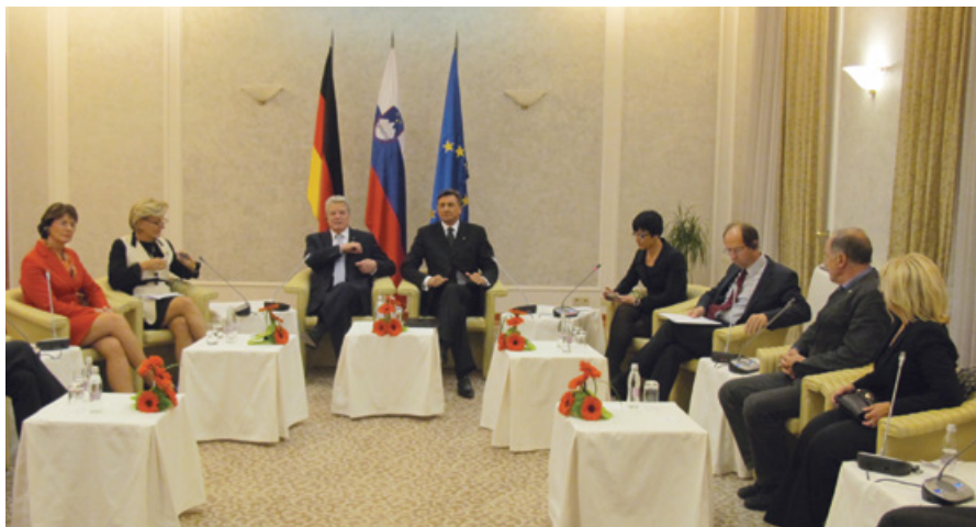
Na okrogli mizi, na kateri so poleg predsednika Nemčije Joachima Gaucka in predsednika Slovenije Boruta Pahorja sodelovali tudi predstavniki sindikatov in delodajalcev iz obeh držav, so bili enotni, da je socialni dialog nujen za doseganje družbenega soglasja.