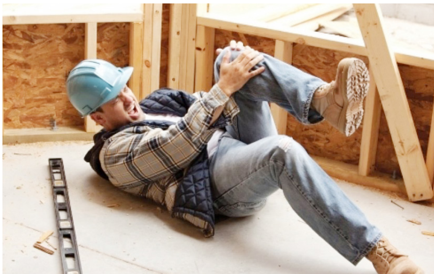
V EU je letno več kot 3 milijone zaposlenih žrtev resnih nezgod pri delu, ki so vzrok za več kot tridnevno odsotnost z dela.

pomembnejši razlogi za obravnavo zdravja in varnosti pri delu v podjetjih navajajo »spoštovanje zakonskih obveznosti« (90 %), »pritisk zaposlenih« (76 %) in »pritisk inšpektorjev za delo« (60 %), ki so vsi pomemben dejavnik ustvarjanja pritiska. Po drugi strani pa je iz te raziskave razvidno, da je zgolj 37 % podjetij, ki ne izvajajo rednega pregleda na področju varnosti, kot razlog za to navedlo »zelo zapletene zakonske obveznosti«.