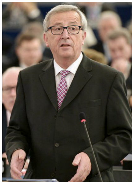
Predsednik Evropske komisije Jean-Claude Juncker je konec novembra predstavil naložbeni načrt za Evropo.

Naložbeni načrt, ki ga je Evropska komisija pripravila skupaj z Evropsko investicijsko banko (EIB), sestavljajo trije glavni sklopi. Ustanovljen bo novi evropski sklad za strateške naložbe (EFSI), ki naj bi na podlagi jamstev, financiranih z javnimi sredstvi, v