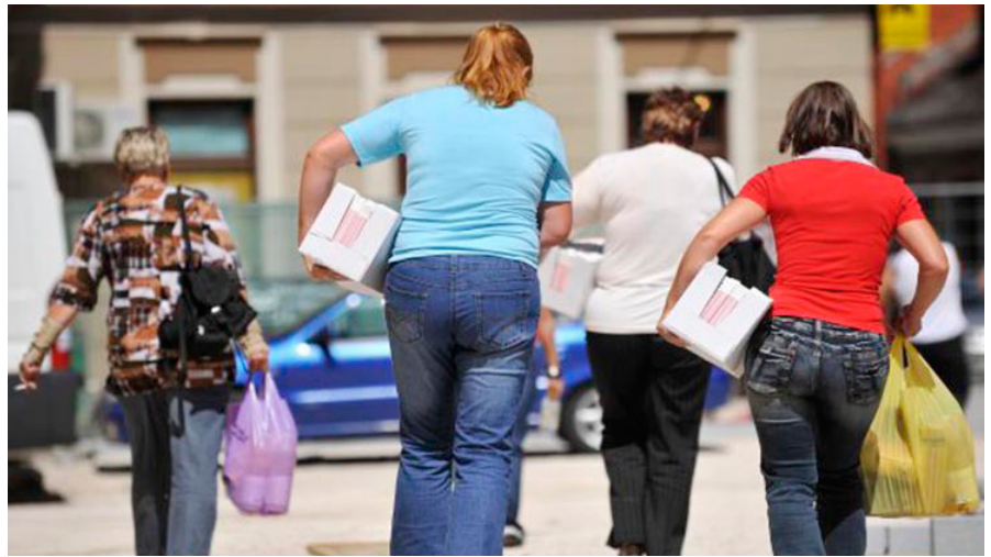
V Sloveniji bodo sredstva Sklada za evropsko pomoč najbolj ogroženim porabljena predvsem za hrano za najbolj ogrožene osebe.

V obdobju 2014-2020 je Skladu za evropsko pomoč najbolj ogroženim namenjenih 3,8 milijarde evrov. Poleg tega morajo države EU izvajanje svojih nacionalnih programov najmanj 15-odstotno sofinancirati z nacionalnimi sredstvi.