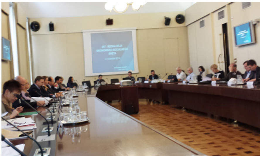
Socialni partnerji so se na začetku decembra začeli pogajati o socialnem sporazumu, ki naj bi ga po dogovoru na Ekonomsko-socialnem svetu sprejeli še letos.

Socialni partnerji so se dogovorili, da se bodo pogajali vsak ponedeljek in torek. Na drugih pogajanjih so ob navzočnosti ministra za finance Dušana Mramorja obravna-