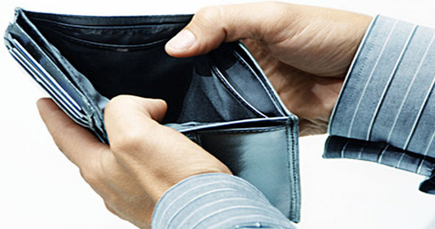
Po novem lahko dolžniku v postopku izvršbe poberejo s transakcijskega računa sredstva do višine 70 odstotkov minimalne plače.