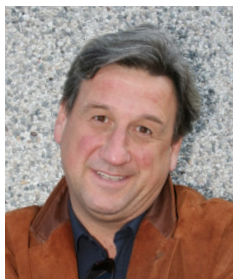
Piše: Roman Končar