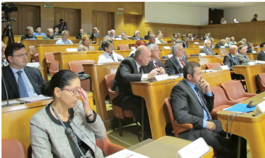
Na posvetu o oživitvi in razvoju slovenskega gradbeništva so sodelovali tudi številni gradbeni strokovnjaki in menedžerji gradbenih podjetij iz vse Slovenije.