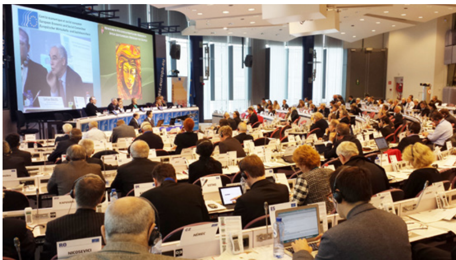
EESO poudarja, da je treba sistem merjenja BDP dopolniti s sistemom za merjenje učinkov, ki jih imajo sprejeti ukrepi na družbo, družine in posameznike.

Število oseb, ki jih ogrožata revščina in socialna izključenost, se je med letoma 2009 in 2012 povzpelo s 114 milijonov na 124 milijonov, zato bo EU težko dosegla cilj zmanjšanje števila oseb, ki jim grozi revščina ali socialna izključenost na 96,4 milijona do leta 2020. Že tako hudo stanje poslabšuje še povečevanje števila oseb, ki živijo v materialnem pomanjkanju, pa tudi oseb v delovni dobi, ki živijo v gospodinjstvih, v katerih nihče ne dela.