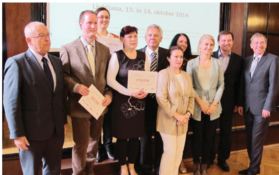
Prejemniki nagrad skupaj z nosilci projekta ProZDRAV