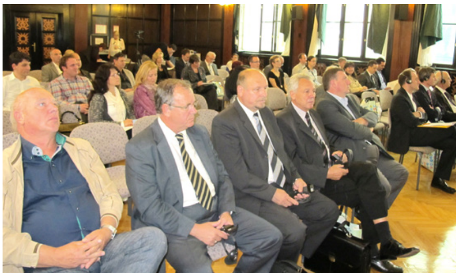
Na mednarodni konferenci so poleg partnerjev v projektu ProZDRAV sodelovali tudi mnogi ugledni strokovnjaki za varnost in zdravje pri delu iz Slovenije in tujine.

stotine milijonov letno) je postavil v ospredje delovanja delodajalskih organizacij in sindikata, hkrati pa je omenjene organizacije med seboj tesno povezal.