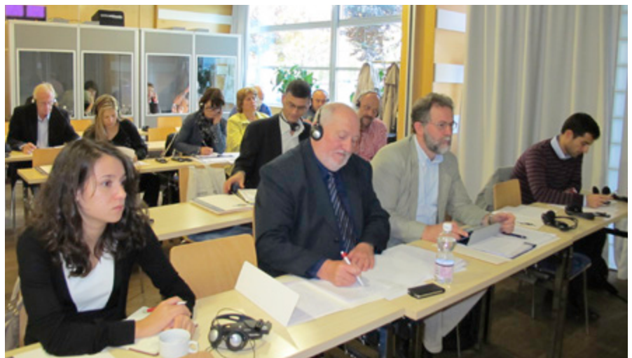
Na seminarju v okviru projekta InArco so sodelovali sindikalisti iz treh držav: Italije, Francije in Slovenije ter predstavniki slovenskega finančnega ministrstva.

Problem pri delavcih iz Slovenije, ki delajo v Italiji in Avstriji, živijo pa pri nas, je v tem, da imajo v tujini višje plače in višje davčne olajšave. Zato morajo naši delavci v Sloveniji doplačati dohodnino, saj so jo tako kot vsi drugi državljani dolžni plačati po naši dohodninski lestvici ob upoštevanju olajšav pri nas.