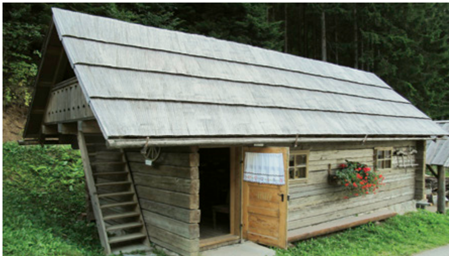
Domačija pokrita s šintli.