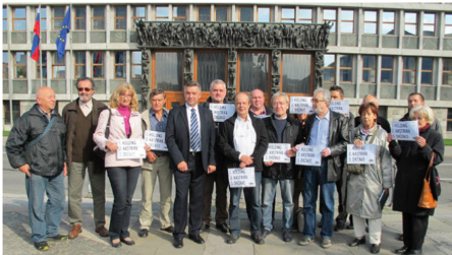
Protesta proti predlogu Zakona o Slovenskem državnem holdingu pred poslopjem parlamenta so se udeležili številni ugledni razumniki.