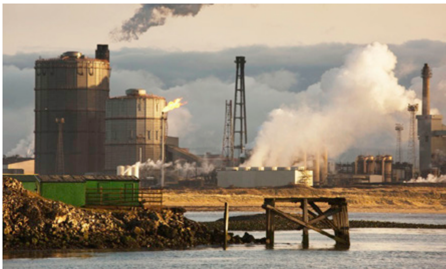
Evropska unija je že sredi devetdesetih let začela s kampanjo za omejitve segrevanja ozračja na svetovni ravni na 2°C nad mejo pred industrijsko dobo, toda trendi na tem področju so ravno nasprotni.

Po mnenju EESO je bistvenega pomena, da se ukrepi, povezani s podnebjem, vključijo v različne politike in finančne instrumente Unije (kohezijski sklad, struktur-