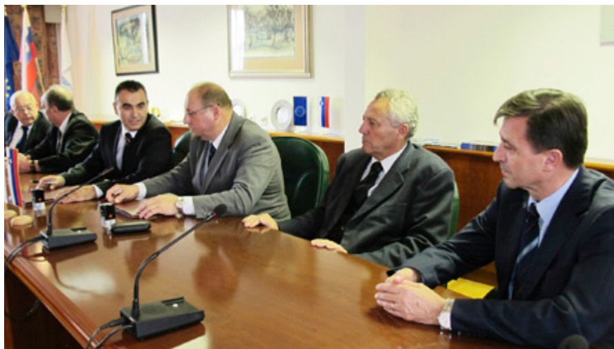
Podpisa nove kolektivne pogodbe za obrt in podjetništvo so se udeležili najvidnejši predstavniki ZDOPS in SOPS.

Nova kolektivna pogodba posveča veliko pozornosti tudi mimnemu reševanju sporov z mediacijo in arbitražo.