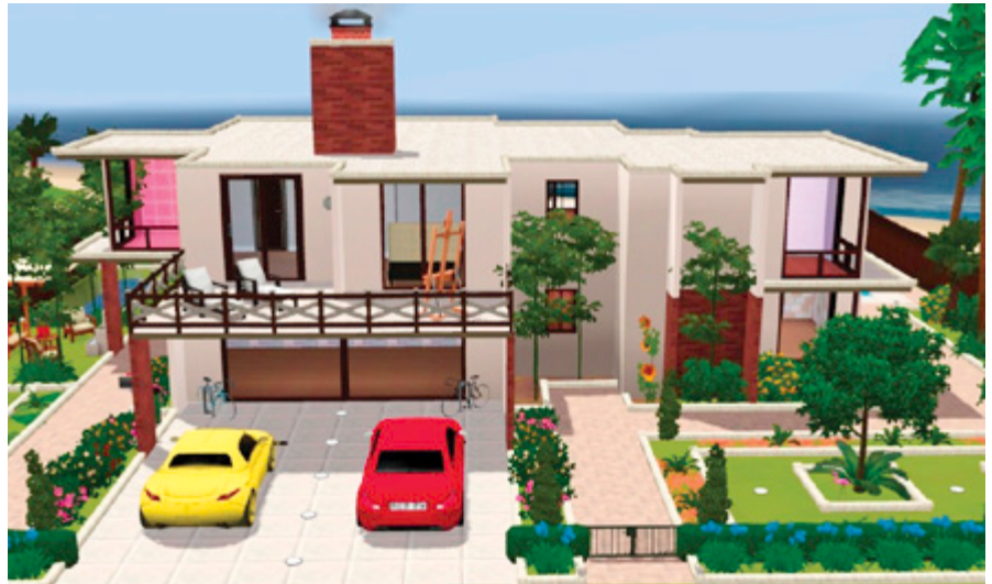
Lastniki bodo po novem za stanovanja oziroma hiše (skupaj z zemljišči, na katerih stojijo), v katerih prebivajo ali jih dajejo v najem, plačevali 0,15 odstotni davek.

Prejemniki socialne pomoči ali varstvene dodatka bodo plačevali polovico nižji davek na nepremičnino, v kateri živijo, invalidi na invalidskih vozičkih pa 30 odstotkov nižji. Kdor ne bo mogel plačati davka, bo lahko dal predlog, da se mu država vknjiži na nepremičnino.