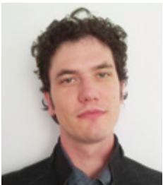
Piše: Matija Drmota , univ. dipl. prav.