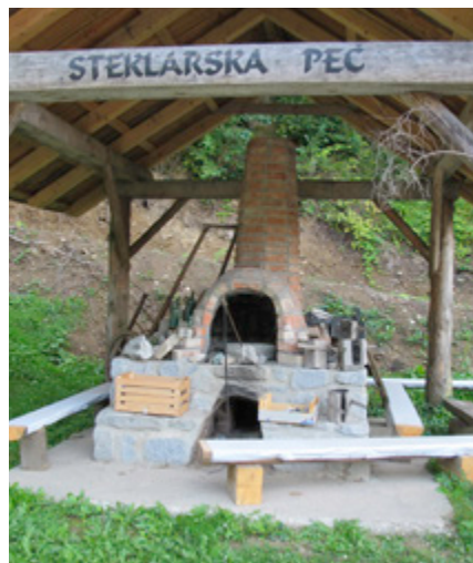
V takšnih glazutah so proizvajali steklo.