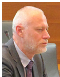
Predsednik državnega zbora dr. Milan Brglez