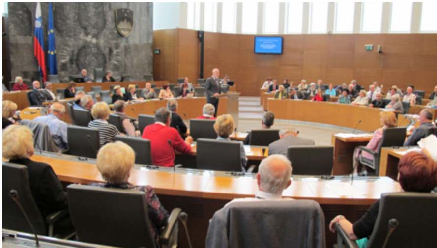
Udeleženci posvetovanja o nujnih spremembah zdravstvenega sistema so se zbrali v veliki dvorani državnega zbora.

tljive in hkrati najbolj obsežne so po Brglezovih besedah ekonomske in socialne posledice staranja prebivalstva, ki jim je zato treba posvetiti dovolj pozornosti, ne pa si zgolj zatiskati oči pred neželjenimi posledicami. Predsednik državnega zbora je ob tem dejal, da v Sloveniji na te izzive še nismo najbolj pripravljeni in zato jim za enkrat tudi še nismo v