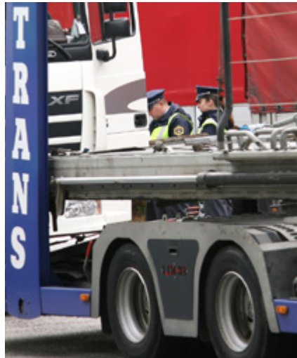
Policisti so v sodelovanju s cariniki konec julija poostreno preverjali, kako vozniki tovornih vozil in avtobusov spoštujejo predpise. Pregledali so 43 tovornih vozil in 8 avtobusov ter zaznali preko 20 kršitev.

zilih so ugotovili kršitve, povezane s preobremenjenostjo vozil. Dve kršitvi sta bili povezani z nepravilnim delovanjem tahografov. Trije tovornjaki tehnično niso bili brezhibni. Dve kršitvi sta bili povezani s prevozom nevarnega blaga oziroma snovi, tri kršitve pa so se nanašale na obvezni počitek voznikov. Kar trem vozilom so morali policisti odvzeti registrske tablice.