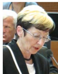
Ministrica za zdravje Milojka Kolar Celarc

je izpostavila ministrica in dodala, da je ob nujnem vlaganju v razvoj primarnega zdravstvenega varstva kot ključno tudi področje javnega