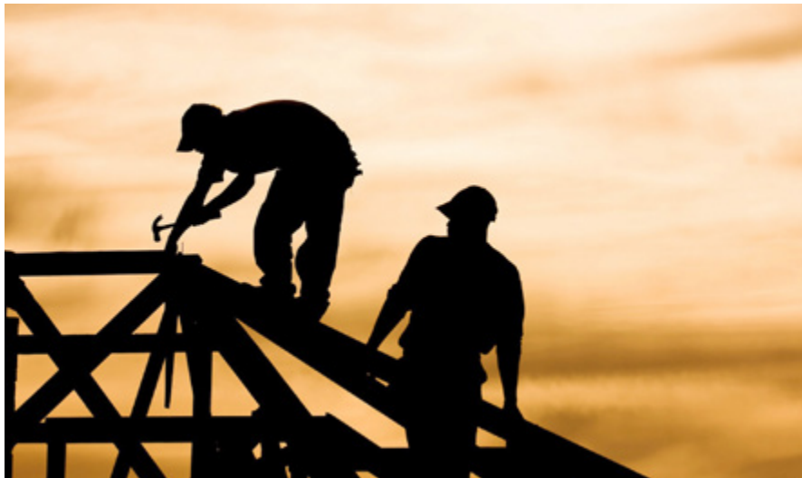
Delo na črno je problem, ki bolj ali manj zadeva vse države članice Evropske unije.

soje druge zaposlitve, samozaposlene, ki si ne želijo urediti statusa, navidezne samozaposlene, nezakonite priseljence, ki opravljajo neprijavljeno delo, ter delavce iz tretjih držav, ki so podizvajalci del v državah članicah EU brez minimalnih standardov za dostojno delo.