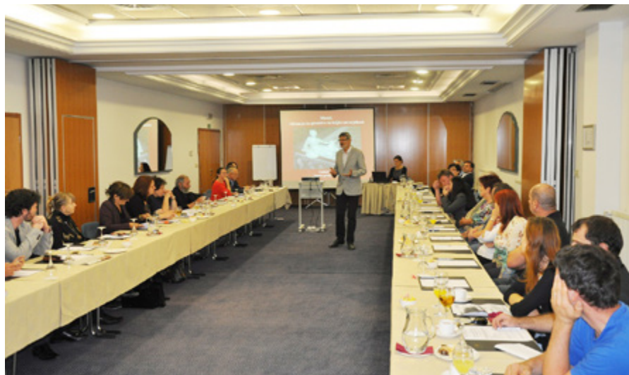
Udeleženci posveta so z zanimanjem prislunhili predstavljenim temam.

razmerja: delavec - delodajalec. Zastavila je vprašanje, katere vrednote zasledujeta? Ali so bolj v ospredju vrednote,