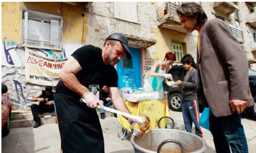
V Atenah je ena od turističnih agencij začela organizirati turistične ogledе po zanemarjenih, revnih in obubožanih predelih mesta.