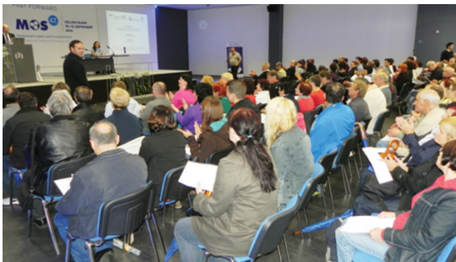
Na delavnici se je zbralo več kot sto udeležencev, med katerimi je bilo največ članov SOPS.

uporabnika popeljejo od prepoznavanja tveganj na delovnem mestu prek preventivnih ukrepov do spremljanja tveganj in poročanja o njih.