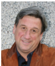
Piše: Roman Končar