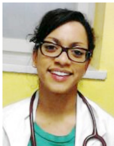
Piše: Maja Sendi, dr. med.