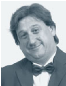
Piše: Roman Končar