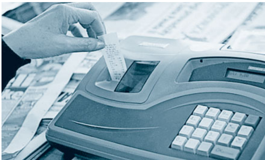
Z zaježitvijo sive ekonomije bi bil proračun manj prazen, dolg pa manjši.

paj presežejo milijardo evrov, je to precej majhna vsota denarja. Če pomislimo, da moramo zdaj tudi za letno servisiranje javnega dolga plačati že za skoraj milijardo evrov obresti na leto, je to še dodaten razlog za zaskrbljenost. Vidimo namreč, kako majhen manevrski prostor imamo pri davkih – ob čedalje večjih izdatkih.