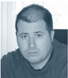
Piše: Gregor Cerar, univ. dipl. prav.

Delavka zaposlena pri samostojnem podjetniku je slišala, da naj bi nov Zakon o pokojninskem in invalidskem zavarovanju (ZPIZ-2) prinesel tudi spodbude za zaposlovanje starejših delavcev, ki naj bi kmalu stopile v veljavo. Zanima jo, za kakšne spodbude gre in kdaj bodo začele veljati.