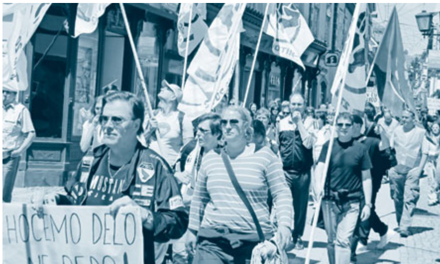
Na katastrofalne gospodarske in socialne razmere v Mariboru in širši okolici so v Mariboru letos že večkrat opozorili demonstranti in vstajniki. Nazadnje meseca junija na delavskem uporu, ki so ga pripravili delavci Mariborske livarne.