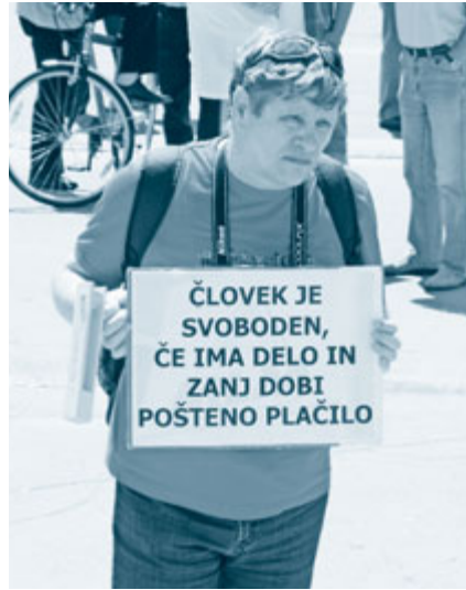
Za subvencije za zaposlovanje brezposelnih iz težje zaposljivih skupin je za obdobje 2013–2014 na voljo 19 milijonov evrov, kar bo zadoščalo predvidoma za 4.950 zaposlitev.

Zavod za zaposlovanje delodajalcem subvencijo izplača v enkratnem znesku po zaposlitvi brezposelne osebe. Na zavodu imajo za te subvencije za obdobje