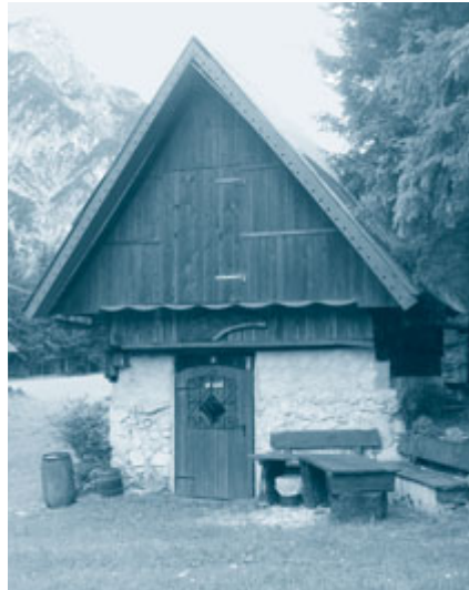
Predlog zakona določa različne stopnje za različne vrste nepremičnin in sicer za stanovanjske 0,15 %, za poslovne in industrijske 0,8 % ter za druge vrste rabe (na primer za javno, kmetijsko) 0,5 %.

Po mnenju obrtno-podjetniške zbornice je stopnja 0,80 odstotka za obdavčitev poslovnih objektov ob občutno višji davčni osnovi v višini posplošene tržne vrednosti