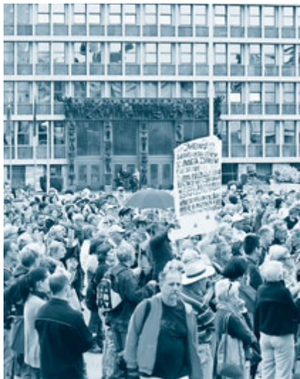
Na dan državnosti, 25. junija, je civilna iniciativa v središču Ljubljane pripravila shod za ohranitev javnega zdravstva, na katerem se je zbralo nekaj tisoč ljudi.

jalca. Zdravstvenim delavcem predlog zakona zagotavlja tudi pravico do počitka. V času počitka ne sme opravljati zdravstvenih storitev, število nadur za zdravstvene delavce pa bo omejeno.