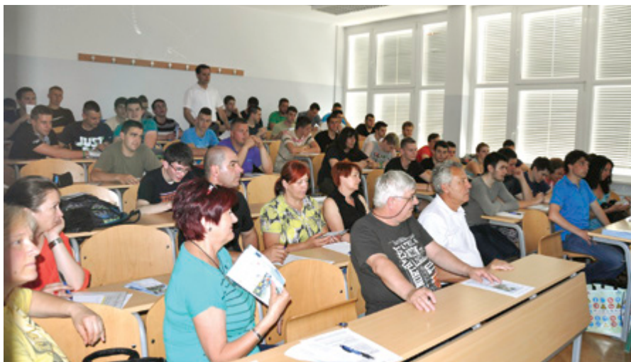
Posveta so se udeležili predstavniki vseh generacij, ki se trenutno srečujejo na trgu dela, in sicer tako imenovane generacije veteranov, otrok blaginje, generacije X in generacije Y.

šalo kar za 16 %). Število ljudi, starih od 40 do 54 let se je prav tako začelo zmanjševati leta 2010, hkrati se je število starejših od 55 let zvišalo za 9,6 % med letom 2005 in 2010 ter se bo za 15,5 % med letom 2010 in 2030. Če te podatke smiselno povežemo z delom, bodo potrebne prilagoditve delodajalcev na demografske trende, kar pomeni da bodo morali poiskati oporo v izkušnjah in znanju starajočih se delavcev, hkrati pa aktivno pripravljati mlajše od 55 let., da jih bodo zamenjali. Trenda »umik starejših delavcev s trga dela in pomanjkanje mladih delavcev« v prihodnosti vodita do zmanjšanja usposobljene delovne sile.