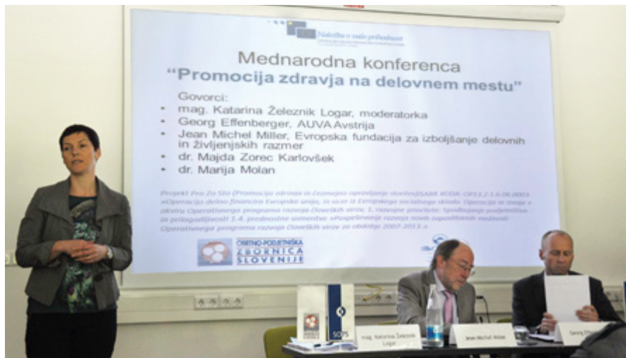
Na konferenci so predstavili podatke, ki kažejo, da večina zaposlenih pri nas meni, da njihovo delo slabo vpliva na njihovo zdravje.

Raziskovalni menedžer iz Evropske fundacije za izboljšanje delovnih in življenjskih