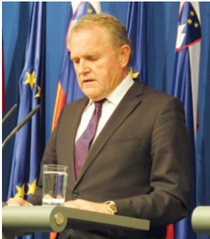
Metod Dragonja: »Borba proti sivi ekonomiji že kaže pozitivne učinke.«

Na novinarski konferenci je prvi spregovoril minister za gospodarstvo Metod Dragonja, saj je dejansko siva ekonomija v prvi vrsti gospodarski problem. Po besedah Dragonje, ki je tudi vodja vladne delovne skupine za omejevanje sive ekonomije, se je obseg sive ekonomije v Sloveniji zaradi ukrepov države zmanjšal in trenutno znaša od 8,5 do 12,2 odstotka bruto domačega proizvoda. Seveda pa je še to veliko preveč.