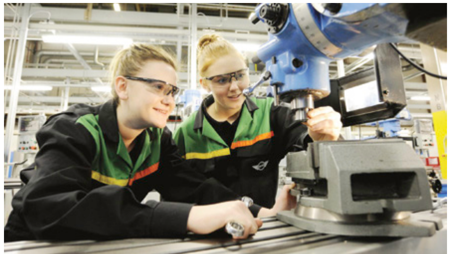
Izobraževalni sistemi v državah članicah z nizko stopnjo brezposelnosti mladih so povezani s podjetji oz. s trgom dela.

Evropski socialni partnerji so junija 2013 sprejeli tako imenovan okvir za ukrepanje na področju zaposlovanja mladih, ki temelji na primerih dobre prakse na štirih prednostnih področjih: na izobraževanju, prehodu iz izobraževanja v zaposlitev, zaposlovanju in podjetništvu. Okvir naj bi nacionalne socialne partnerje spodbudil k iskanju rešitev v lastnem okolju in k prilagajanju teh rešitev nacionalnim okoliščinam.