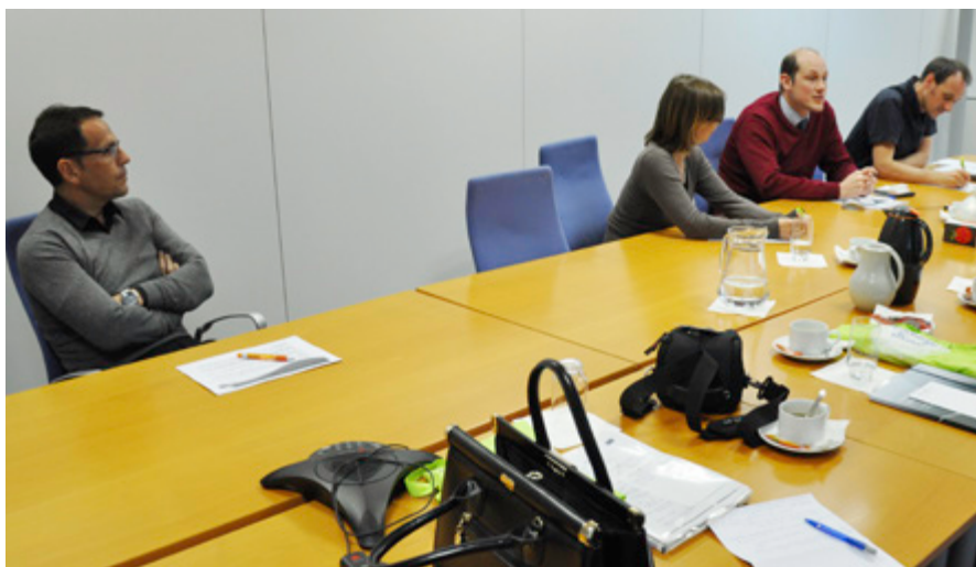
Predstavniki OZS in SOPS so se na študijskem obisku v Bilbao podrobneje seznanili z delovanjem Evropske agencije za varnost in zdravje pri delu.

preti razvoj struktur varnosti in zdravja pri delu, spodbujanje tripartitnega pristopa k reševanju problemov na področju varnosti in zdravja pri delu, razvoj komunikacijskih kanalov med interesnimi skupinami, razvijanje zavedanja o tveganjih na delovnem mestu, prenašanje dobrih praks in podobno,« pojasnjuje Čermeljeva.