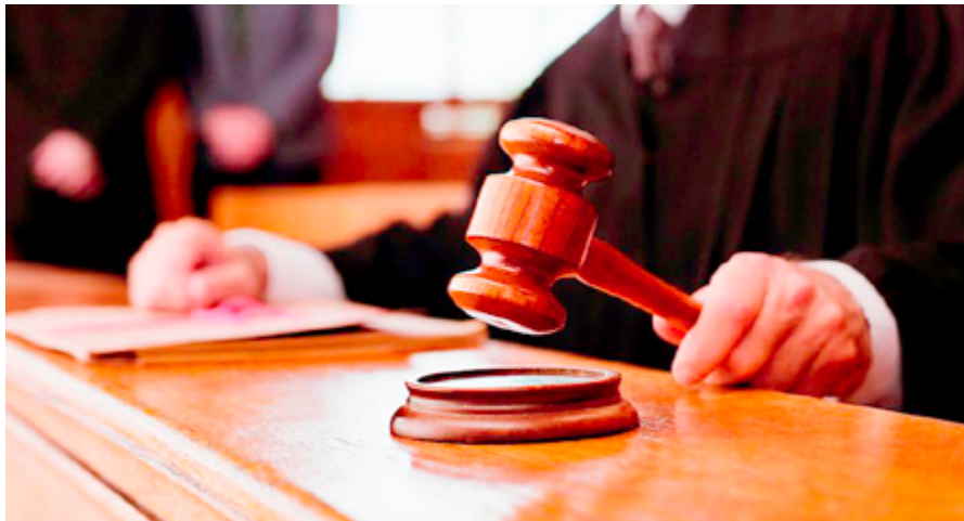
Kdor zavestno ne ravna po predpisih o socialnem zavarovanju in s tem koga prikrajša za pravico, ki mu pripada, ali mu jo omeji, se kaznuje z denarno kaznijo ali zaporom do enega leta.

vkluči v organiziran delovni proces delodajalca in v njem za plačilo, osebno in nepretrgano opravlja delo po navodilih in pod nadzorom delodajalca. Določilo o znesku osnovne (bruto) plače je po določbi 31. člena ZDR-1 obvezna sestavina pogodbe o zaposlitvi. Znesek bruto plače torej sam po