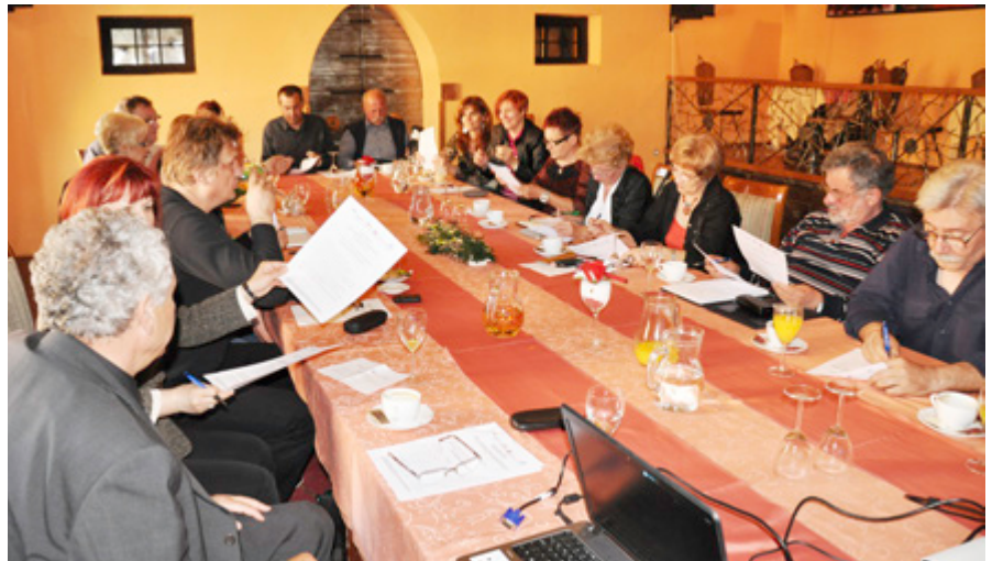
Z delavnice Sindikata obrti in podjetništva Slovenije v Murski Soboti