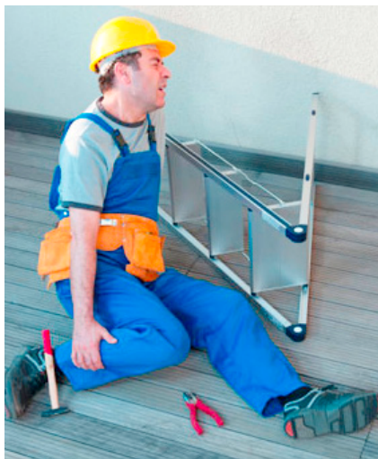
Delodajalci so lani prijavili 9.229 nezdod (8.719 lažjih in 455 težjih).

Na področju nadzora varnosti in zdravja pri delu so inšpektorji najpogosteje ugotavljali kršitve glede ocenjevanja tveganj in izdelave izjave o varnosti z oceno tve-