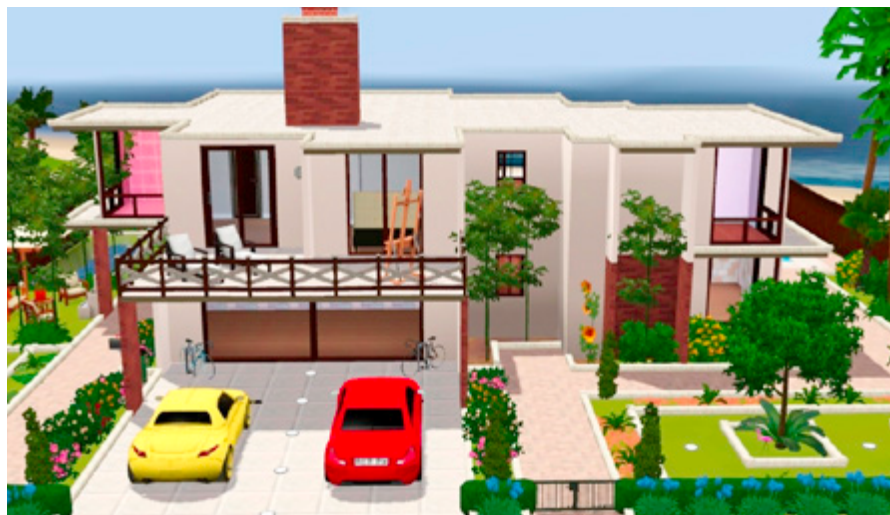
Občine morajo davčni upravi do 30.06.2014 poslati podatke, nato pa bo davčna uprava zavezancem v treh mesecih odmerila nadomestila za uporabo stavbnega zemljišča.

Zato, da bi zmanjšali število pritožb, bodo na davčni upravi izvajali kontrolo podatkov, ki jih bodo dobili iz občin. Vendar pa z vsemi podatki ne razpolagajo, zlasti ne s