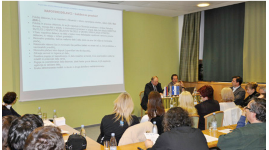
Osrednjo temo delavnice o napotitvah delavcev v tujino je udeležencem predstavil izvršni sekretar ZSSS Goran Lukič.

Osrednjo temo delavnice o napotitvah delavcev v tujino je udeležencem delavnice predstavil izvršni sekretar ZSSS Goran Lukič. Po njegovih besedah je