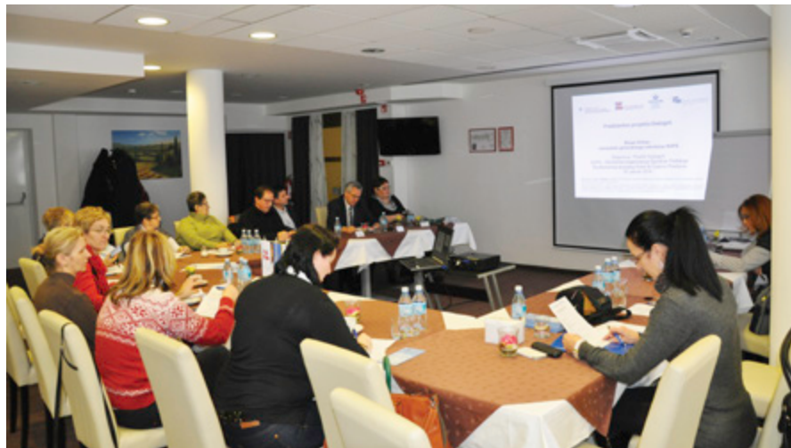
Osrednja tema delavnice SOPS na Ptuj je bila namenjena izboljševanju delovnih pogojev, medgeneracijskemu sodelovanju, usklajevanju zasebnega in poklicnega življenja ter mirnemu reševanju sporov.

Zajškova je opozorila na prednosti mediacije. V primerjavi s sodnim postopkom