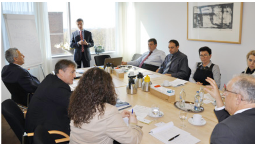
Na študijskem obisku se je slovenska delegacija seznanila z nizozemskim sistemom zdravstvenega zavarovanja, s preventivo in promocijo zdravja in varnosti pri delu ter z orodji za »on-line« ocenjevanje tveganj.

so k njegovi uporabi pritegnila tudi podjetja; v prvi vrsti je orodje brezplačno, digitalna ocena vzame manj časa, omogoča kakovostnejšo oceno tveganja. Ocena tveganja, ki jo naredi določeno podjetje z digitalnim spletnim orodjem in je potrjena s strani pristojne organizacije, je splošno veljavna in priznana ter ne potrebuje nikakršnih dodatnih ocen tveganj s strani inšpektorjev.