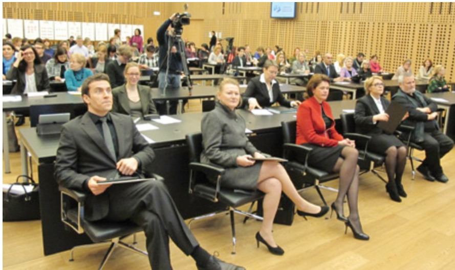
Na mednarodni konferenci o enakosti žensk se je zbralo okoli 150 udeležencev iz Slovenije in tujine.

»Ne moremo si privoščiti neizkoriščenega potenciala žensk,« je poudarila predsednica vlade. Dodala je, da vse študije dokazujejo, da enakopravnost žensk in moških povečuje uspešnost podjetij, poleg tega pa je ekonomska neodvisnost predpogoj, ki slehernemu posamezniku in posameznici zagotavlja samostojno upravljanje s svojim življenjem. Zato je Slovenija tudi v skupini držav članic Evropske unije, ki podpira predlog Evropske komisije za sprejem Direktive o zagotavljanju uravnotežene zastopanosti spolov na direktorskih me-