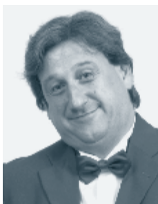
Piše: Roman Končar