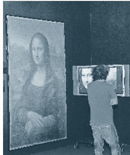
Razstava prikazuje tudi inovativno analizo Mone Lise, ki odstira njene skrivnosti.