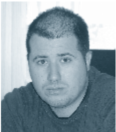
Piše: Gregor Cerar, univ. dipl. prav.

Delavka je že 12 let zaposlena pri samostojnem podjetniku. Sklenjeno ima pogodbo za nedoločen čas za polni delovni čas. Delodajalec ji je napovedal, da ji bo zato, ker se je obseg dela v podjetju zmanjšal, ponudil v podpis novo pogodbo in jo zaposlil le za 4 ure. Delavka se s tem ne strinja in sprašuje, kaj se zgodi če te pogodbe ne podpiše. Zanima jo tudi, ali jo delodajalec v tem primeru lahko odpusti in ji ni dolžan plačati odpravnine.