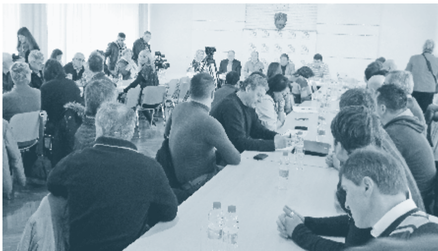
Okoli 50 predstavnikov sindikatov iz podjetij v državni lasti je dvignilo glas proti razprodaji državnih podjetij brez vsakršnih analiz.