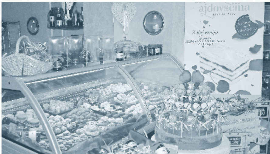
V Slaščičarni Ajdovščina imajo bogato ponudbo butično izdelanih piškotov, različnih čokoladnih izdelkov, tort, sladoledov in domačih marmelad.

Že ob vhodu v slaščičarno se gostu ponuja bogata izbira, med katero ne gre prezreti edinstvene skrinje butično izdelanih piškotov, različnih čokoladnih izdelkov in širokega spektra domačih marmelad. Tu so še torte, pri katerih upoštevajo še tako nenavadno željo naročnika. Imajo tudi posebno recepturo za izdelavo sladoledov in italijansko-francoskih semifreddov, ki se