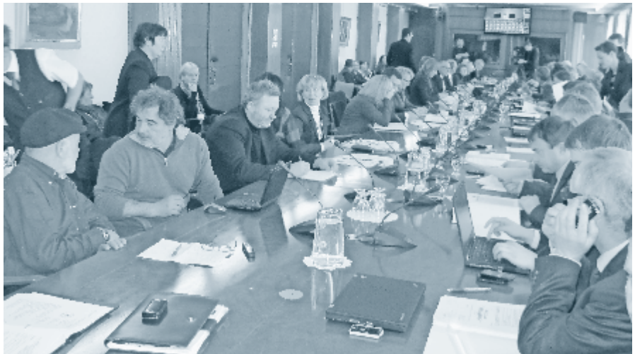
Za to, da voda ostane javno dobro, so se zavzeli tudi člani treh odborov državnega zbora na nujni skupni seji o predlogu evropske direktive o koncesijah.