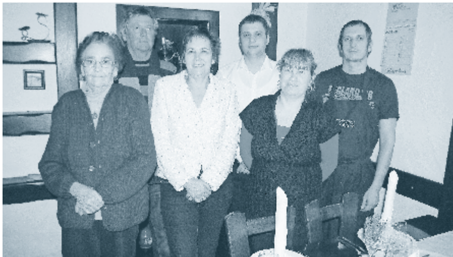
Kolektiv Gostilne Mencinger

let stari Gostilni Mencinger, v Črešnjecih pri Gornji Radgoni.