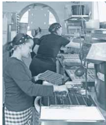
Izdelava čokoladnih izdelkov v čokoladnici Letras

»Do 14 ton čokolade porabimo. Izdelujemo pa tudi sladolede, slaščice in torte.