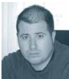
Piše: Gregor Cerar, univ. dipl. prav.

Delavca zaposlenega pri obrtniku, zanima, ali mu je delodajalec dolžan zagotoviti zaščitna delovna sredstva (očala za brušenje, rokavice, čevlje in delovno obleko) in na kakšno časovno obdobje je upravičen do njihove zamenjave.