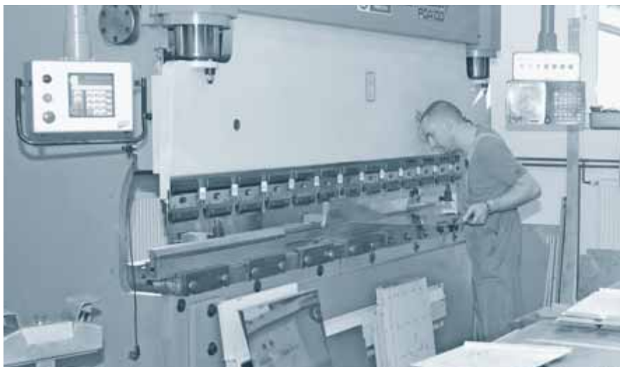
V delavnici podjetja »Gostinska oprema Kastelic«

»So, so. Posla imamo vse več in bi se lahko širili, vendar sem previdna. Potrebujem trdno finančno konstrukcijo. Ni se mogoče širiti samo s krediti. Zdaj skušamo izboljšati poti materiala po proizvodni liniji. Morda bomo gradili nove poslovne prostore drugje, tudi zaradi slabih poti za velike transporterje. Toda selitev, denimo v industrijsko obrtno cono v Grosuplje, bi veliko stala. Ali pa, če bi v Grosupljem postavili vsaj skladišče. Bomo videli. Trenutno vlagamo več v stroje in izobraževanje.«