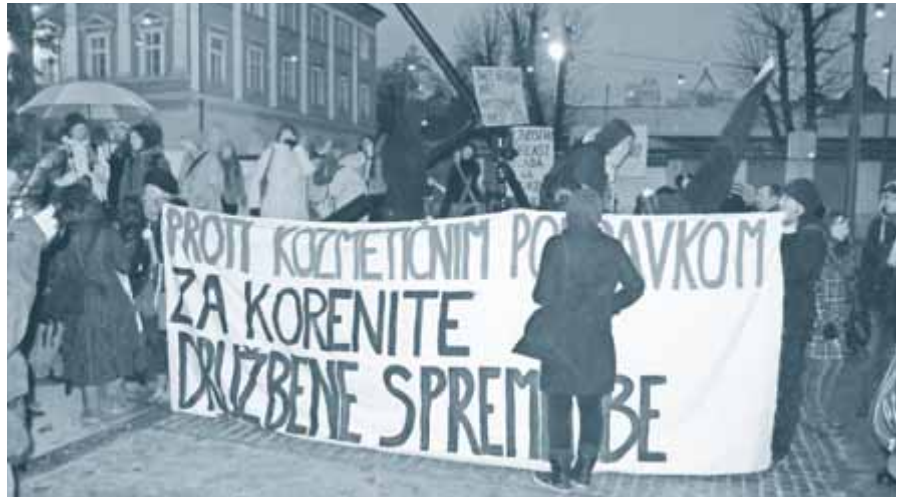
Utrinek z enega izmed protestov v Mariboru

takoj preneha z uničevalno politiko varčevalnih ukrepov po diktatu evropske finančne elite. Prav tako zahtevajo, naj izvede hitro in učinkovito spremembo zakonodaje in organizacije sodnega sistema, s katero bo prišlo do sojenja in zaplembe premoženja vsem, ki so v Sloveniji v zadnjih 20 letih izvršili krajo skupnega premoženja in uničili nekdanj cvetoča podjetja in gospodarstvo. Terjajo tudi spremembe volilne zakonodaje, ki bo bistveno povečala vpliv državljanov in državljanov na sestavo dr-