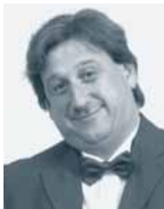
Piše: Roman Končar