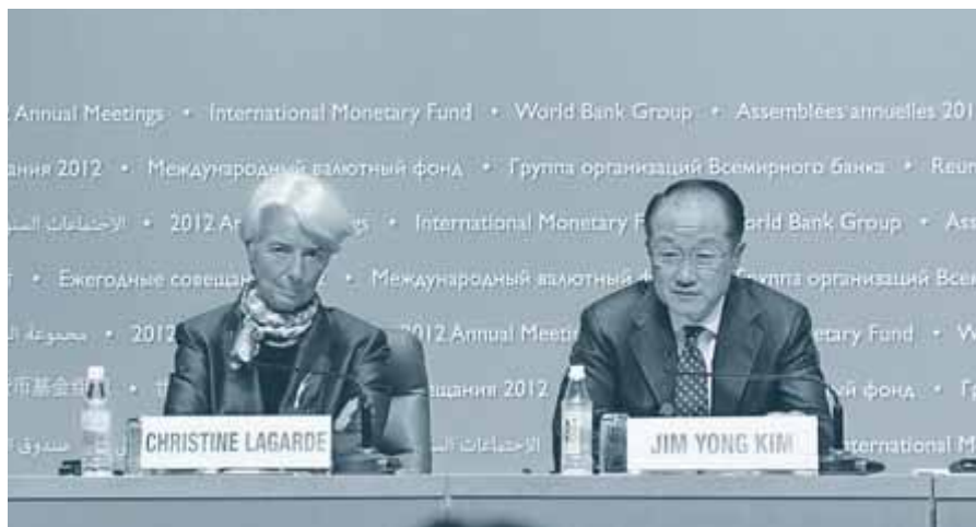
Direktorica MDS Christine Lagarde in predsednik Svetovne banke Jim Yong Kim na zasedanju v Tokiu, oktobra lani, na katerem je MDS predstavil rezultate analize, ki kažejo, da ostro varčevanje ne vodi iz krize.

vija, da so absolutne vrednosti za multiplikatorje celo višje od tistih, ki so omenjene v njegovem Svetovnem gospodarskem pregledu. Krčenje javnih financ v višini 1% bruto domačega proizvoda, ki se ga izvaja v razmerah gospodarske recesije in ki temelji na rezanju odhodkov, bo v primeru evroobmočja zmanjšalo gospodarsko dejavnost za 2,5 odstotka. To dejansko pomeni, da bo tovrstna javnofinančna konsolidacija primanjkljaj celo povečala, namesto, da bi ga znižala! V skladu z zmanjševanjem gospodarske dejavnosti bodo javni prihodki upadli, ob tem pa se bodo povečala izplačila nadomestil za brezposelnost.