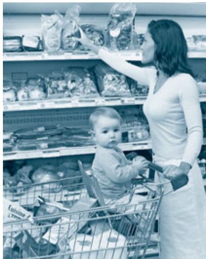
Poraba gospodinjestev v Sloveniji se je v prvem četrtletju povprečno zmanjšala za več kot pet odstotkov.

jemo tudi manj davkov, od DDV do davka na dobiček podjetij, državna blagajna pa je čedalje bolj prazna. Začarani krog se tako nadaljuje. Ob vsem tem pa nas prihodnji mesec, sredi julija, čaka še novi, zelo varčevalni rebalans državnega proračuna 2013. Ta bo narejen na že novih, znižanih predpostavkah gospodarske rasti in iz njih bo izhajal večji primanjkljaj – in lahko si zamislimo, da bo spet glavna tema varčevanje. Edina dobra plat te dokaj nesrečne zgodbe je za zdaj nizka stopnja inflacija,