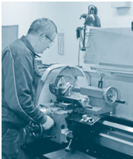
V Precizni mehaniki Kunaver

»Precej sem vpet v Območno obrtno zbornico Ljubljana-Šiška, saj sem njen predsednik, in tudi v republiško krovno organizacijo sem bil. Menim, da je prav, da tvorno sodelujem, če sem že član. Dva mandata sem bil predsednik sekcije kovinarjev pri OZS. Tu sem si zadal nalogo, da obrtnike-kovinarje nekako povežem, da se bomo bolje spoznali, se interesno povežali, skupaj reševali pereče zadeve. Iz takih srečanj in poznanstev je nastal tudi »moj« grozd. Tega, da se je treba družiti, se interesno povezovati, se pri nas premalo zavedamo. V tujini so obrtniki dosti bolj interesno povezani.«