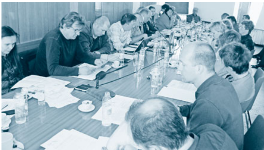
Predsedstvo ZSSS vladi predlaga, da naj namesto ostrih varčevalnih ukrepov sprejme več ukrepov na prihodkovni strani.

Člani predsedstva ZSSS so se zavzeli tudi za uvedbo skupnih javnih naročil za ves sektor država. Predlagajo tudi, da bi bile za plačevanje v zdravstveno in pokojninsko blagajno enakomerno obremenjene vse kategorije zavarovancev od zaposlenih do samostojnih podjetnikov in kmetov. Zavzeli so se tudi za dvig davka na dohodek pravnih oseb na 20 odstotkov.