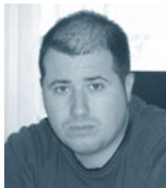
Piše: Gregor Cerar, univ. dipl. prav.

Delavca zaposlenega pri samostojnem podjetniku zanima, ali je v času trajanja odpovednega roka dolžan normalno delati. Zanima ga tudi, ali lahko v času odpovednega roka odkloni delo, ki mu ga naloži delodajalec in za katerega meni, da ne sodi v obseg njegovih delovnih nalog.