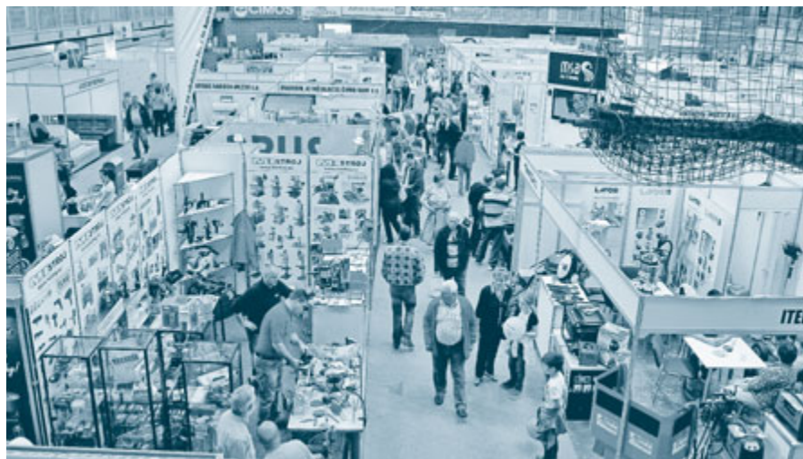
Na sejmju je razstavljal preko 200 podjetij iz Slovenije in tujine.

ustanovah. Zanimivo je bilo tudi na predavanju, kako narediti celostno grafično podoba organizacije, pa na predavanjih in svetovanjih s področja energetike, ter o optimaliziranju davkov in davčnem vidiku licenčnih. Veliko pozornosti obiskovalcev je poželo tudi predavanje o naturopatiji, alternativnem medicinskem sistemu, ki temelji na človekovi lastni moči zdravljenja. Naturopat namreč poišče energetske in psihične blokade v posamezniku ter odpra-