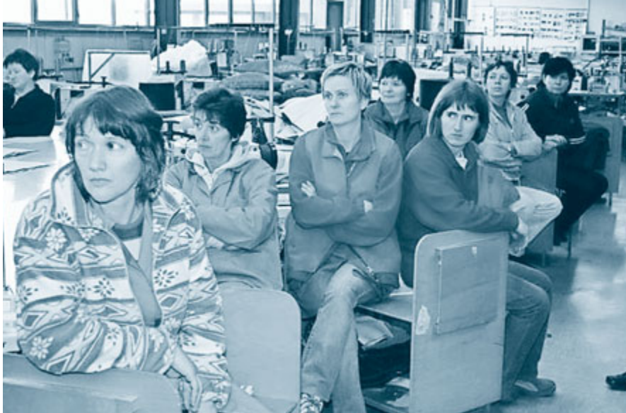
Novela zakona je izboljšala položaj delavcev kot upnikov. Če bo insolventni dolžnik za več kot 15 dni zamudil s plačilom plač delavcem do višine minimalne plače ali s plačilom davkov in prispevkov od teh plač, je to po novem razlog za ugovor proti prisilni poravnavi.