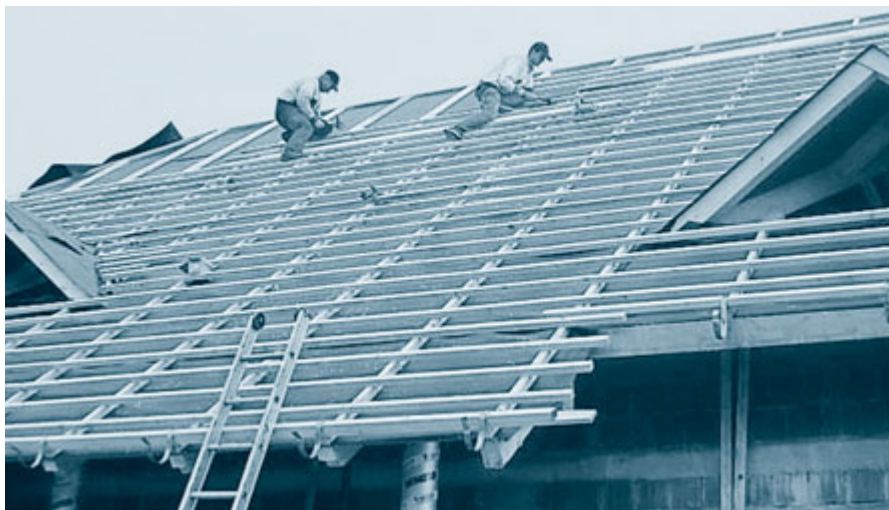
V Tesarstvu Kosec izdelujejo ostrešja iz kakovostnega rezanega ali lepljenega lesa.

Kljub krizi je naše podjetje doslej kar dobro poslovalo. Prihaja sicer do vzponov in padcev, vendar poslovanje ni ogroženo, čeprav povpraševanje po naših storitvah ni tolikšno, kot bi želeli. Prepričan pa sem,