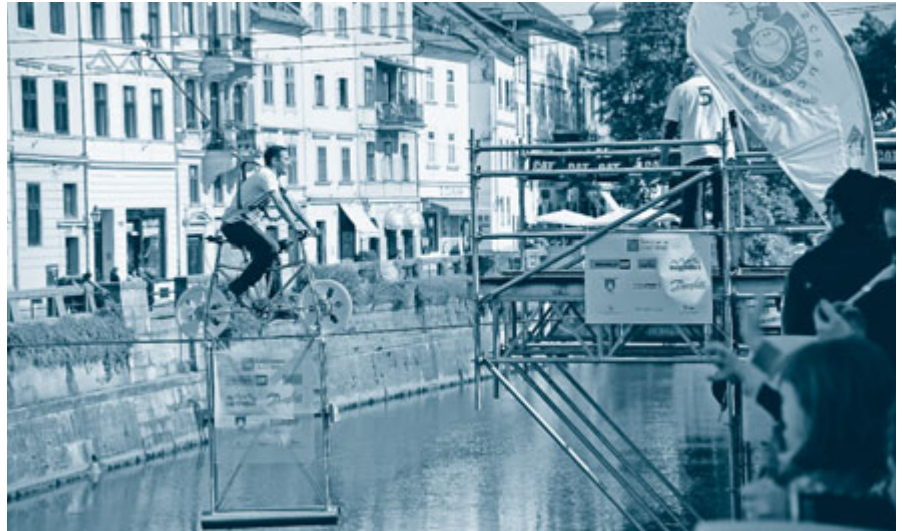
Glavna zanimivost letošnjega Znanstivala je bila vožnja z kolesom po napeti jekleni žici preko Ljubljane.

magalo z izkušnjami ter merilcem velikih sil, trgovina Anapurna pa je posodila varnostno opremo za kolesarje. Piko na i varnosti sta dodala še dva reševalca ob vrvi in gasilski čoln v vodi. Zanimanje občinstva je bilo izjemno, kolo skoraj ni prišlo do sape.