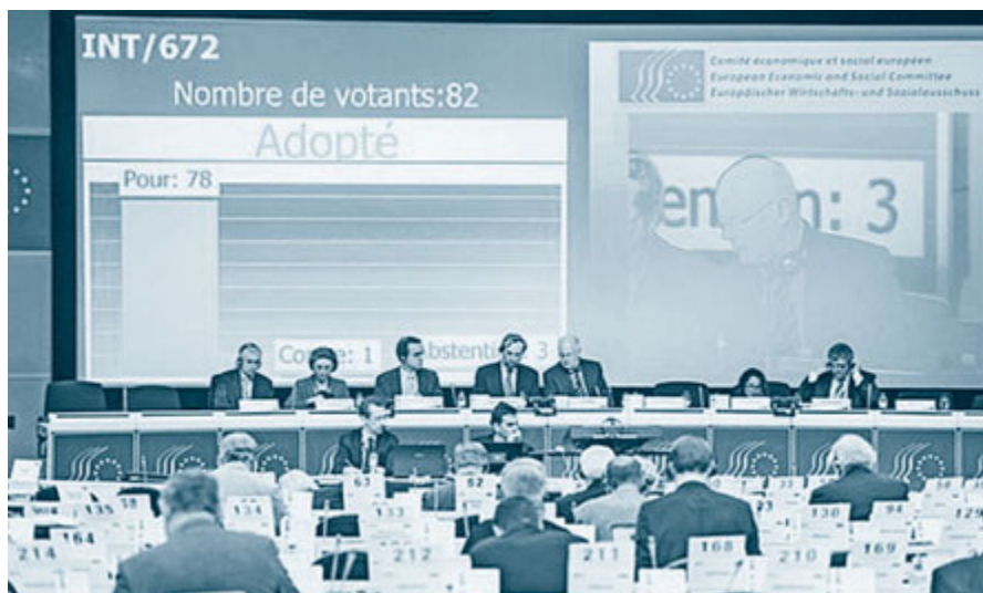
Po mnenju EESO morajo biti najpomembnejše prednostne naloge EU: okrepitev konkurenčnosti, spodbujanje večje rasti, ustvarjanje novih delovnih mest in zmanjšanje revščine.

EU si mora po mnenju EESO resneje in konkretnije prizadevati za zmanjšanje in izkoreninjenje revščine. V okviru evropskega semestra je treba vsaj dejavno uresničevati zaveze iz strategije Evropa 2020 v obliki vodilnih pobud, in sicer da se 20 milijonov ljudi reši revščine, česar ne smejo ogroziti ukrepi za zmanjšanje primanjkljaja. EESO pripravlja tudi pregled shem minimalnega zajamčenega dohodka v državah članicah, da se bodo lahko opredelile in spodbujale dobre prakse po vsej